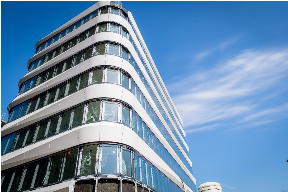
Die lichtdurchlässige Glasfassade mit den eleganten, plastisch geformten Brüstungsblechen wird aktuell am EUROPA-CENTER Gateway Gardens montiert.